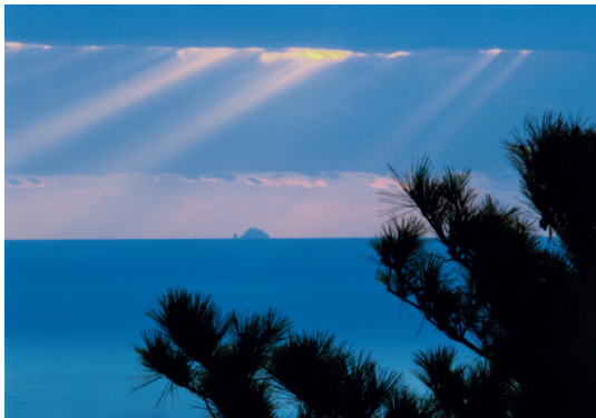
资料一 在郁陵岛上望见的独岛

地理上独岛是个位于我们东海上离郁陵岛 87.4公里 的美丽岛屿。早在朝鲜初期编撰的『世宗实象地理志』(1432年)就有“于山(独岛)、武陵(郁陵)··本二岛，相距不远，风日清明，则可望见”这样的记录。由此可见在郁陵岛晴天时用肉眼可以望见的唯一岛屿就是独岛，而郁陵岛的居民自然把独岛视为郁陵岛的附属岛屿。