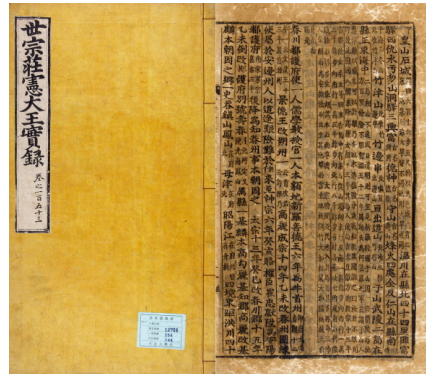
资料二 『世宗实象地理志』 (1432年)，奎章阁所藏

根据最近一份调查结果显示，郁陵岛从先始时代就有人居住的可能性很高，但出现在文献里是从6世纪初(512年)新罗服属于山国开始的。在『世宗实象地理志』(1432年)中，把于山国的版图称为武陵岛(郁陵岛)和于山岛(独岛)，其后的主要官撰文献『高丽史地理志』(1451年)、『新增东国輿地胜览』(1530年)、『东国文献备考』(1770年)、『万机要览』(1808年)、『增补文献备考』(1908年)等上均将独岛的旧地名记载为“于山岛”，可见该地名一直用到20世纪初。从这一点上来看，独岛分明一直是属于我国的领土。