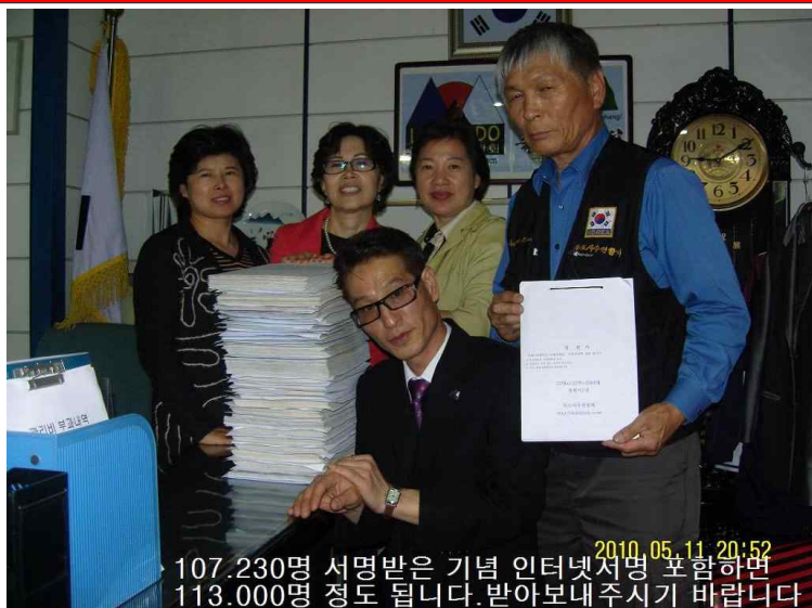
107,230명 서명받은 기념 인터넷서명 포함하면 113,000명 정도 됩니다. 받아보내 주시기 바랍니다

↑서명용지 아래는 본회가 서명 받은 것 이후에 받은 것 포함하면 15 만명은 넘는다. 여러분이 같이하면 2천만명 넘을 것입니다.↓